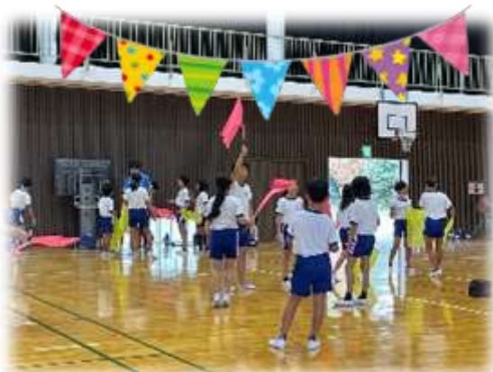
上学年：表現運動練習中

まずは、運動場に出るとびらの上に掲げ、毎日、スローガンの下、練習に取り組んでいます! ここでも、本校が大切にしている縦割り活動が中心です。練習後は、目をキラキラ輝かせ、楽しそうに廊下を歩いています。今から本番が楽しみです! 応援よろしくお祈りします!!