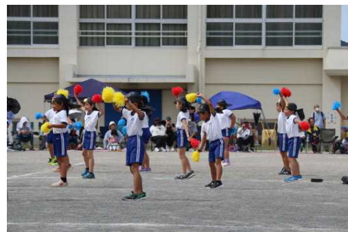
1～3年生によるダンス。かわいかったです。